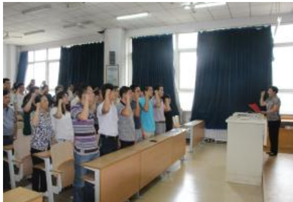
2016年7月1日机关党总支重温入党誓词仪式

本报(记者 孙艳敏/文)7月1日,机关党总支在秦皇岛校区举行全体党员重温入党誓词大会。