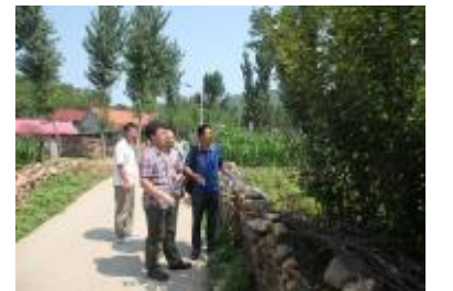
实地考察张庄村周边环境

示了充分肯定,同时就村小学教育、水资源开发与建设、红色文化、生态休闲旅游项目等与工作组和村干部进行了交流。通过实地调研,我校民主党派代表见证了驻村帮扶工作取得的显著成果。纷纷表示,此次调研活动为老师开阔了视野,积累了经验。调研结束后将根据此次实地调研情况,进一步认真思考如何积极发挥自身力量,为我校精准扶贫工作提出更有价值和更具操作性的意见和建议。