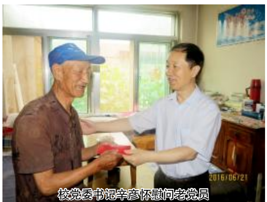
校党委书记辛彦怀慰问老党员