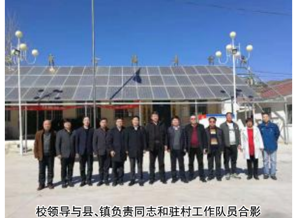
校领导与县、镇负责同志和驻村工作队队员合影

两个贫困村的党支部书记和我校派驻的工作队第一书记分别介绍了村庄的巩固提升规划和构想,提出了在村庄原有产业升级的基础上,构建“学校提供项目和技术支持,政府进行政策和资金引导,农民合作社形成经营主体,贫困户通过就业和分红增收”的帮扶模式,在我校新农村发展中心的协调和支持下,发展中药材种植和羊肚菌栽培两个产