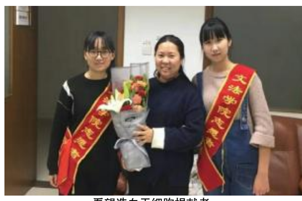
看望造血干细胞捐献者

在开展志愿服务行动的同时,校团委还开辟了“让雷锋精神与青春同行”线上专栏,利用官方微博、微信平台开展了微留言互动活动,同学们可以积极留言,参加“优秀微留言”的评选。各团支部也将在3月围绕“青春奋进新时代,学习雷锋我先行”开展主题鲜明、形式新颖的自主团日活动。为进一步完善和推进志愿服务项目品牌化建设,校团委和各院(系)团委将以此次雷锋月活动为契机,积极创建“学雷锋志愿服务基地”,定期开展活动,形成长效机制,充分发挥学科专业优势,打造具有自身特色的学雷锋品牌项目,服务学校和地方经济社会发展,不断提升我校志愿服务活动影响力。