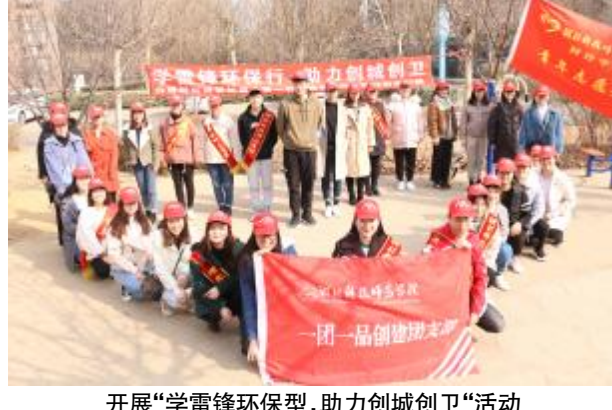
开展“学雷锋环保型,助力创城创卫”活动