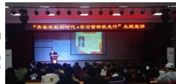
雷锋精神主题宣讲