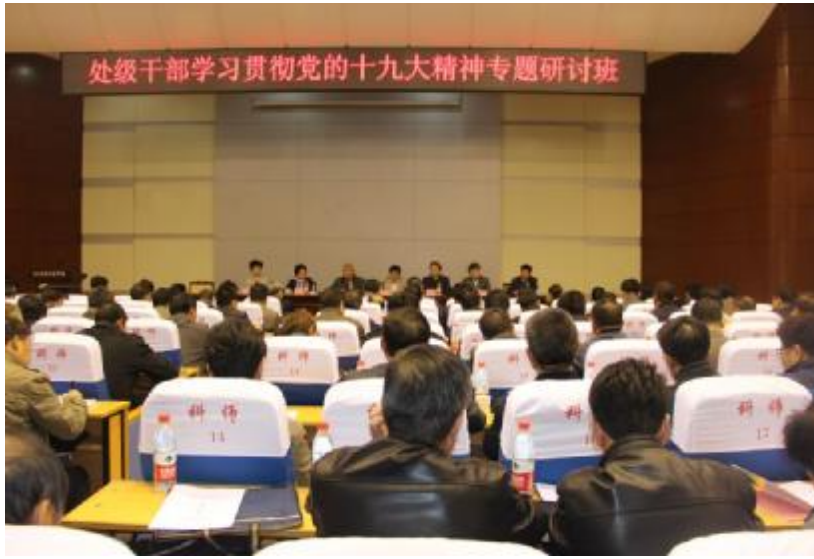
处级干部学习贯彻党的十九大精神专题研讨班

本报讯(记者 孙艳敏)为进一步牢固树立“四个意识”,坚定“四个自信”,做到思想上高度认同核心、政治上忠诚维护核心、组织上坚决服从核心、行动上自觉紧跟核心,切实把思想和行动统一到党的十九大精神上来,统一到党的十九大对高等教育工作提出的目标和任务上来,为全面扎实推进我校教学审核评估、应用型大学转型建设、集中办学、筹建河北海洋大学等重点工作提供有力保障。4月23日起至5月7日,我校处级干部学习贯彻党的十九大精神专题研讨班成功举办。其中4月24日至25日为全天培训,从4月26日开始分上午班、下午班进行,确保每个处级干部参加集中培训时间为5天。深研细悟,融会贯通。几天来,学习研讨班学员们心无旁骛,集中精力投入学习。大家一致表示,通过这次难得的集中学习,进一步强化了“四个意识”、加强了理论武装、明晰了方位目标,明确了思路举措,学出了忠诚,学出了担当,学出了干劲。