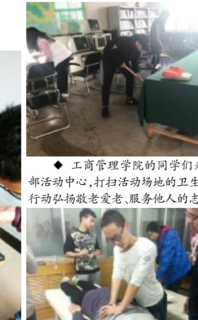
工商管理学院的同学们来到老干部活动中心,打扫活动场地的卫生,用实际行动弘扬敬老爱老、服务他人的志愿精神。