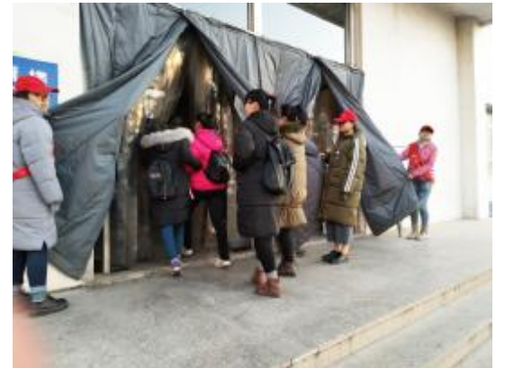
城市建设学院的志愿者们利用课间为匆忙奔波于教学楼之间的老师和同学们掀开门帘,还有的同学拎着水壶为教室里上课的老师送上一杯热水,在气温骤降的天气里,他们的志愿行动给带来了温暖。