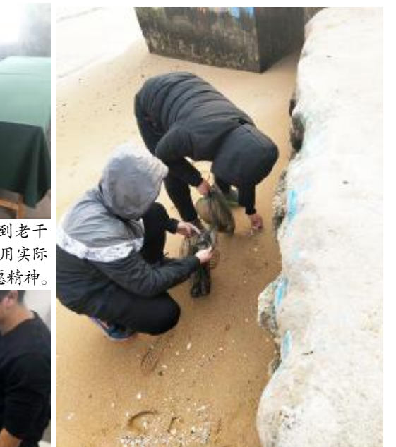
物理的志愿者们来到海边,开展了捡拾海边垃圾志愿服务活动。虽然天气寒冷,但这并不能阻挡志愿者们们的热情,同学们有序地将垃圾放入提前准备好的垃圾袋,并将垃圾袋投入到对应的垃圾筒中。