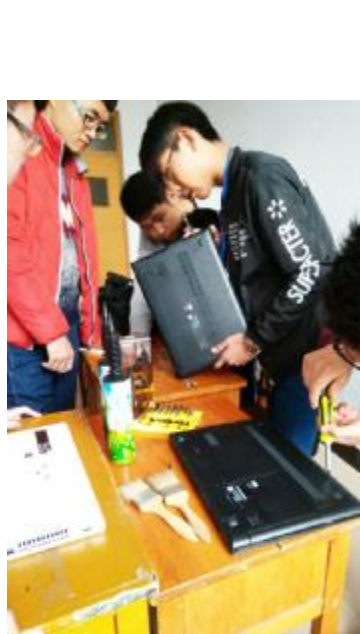
数学与信息科技学院的志愿者们还发挥专业特长在逸夫楼A108教室举行了义务维修电脑活动,受到同学们的普遍欢迎。