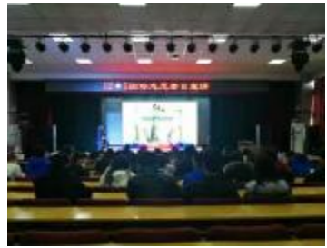
校青年志愿者协会在校园里举办了“弘扬志愿精神,播撒爱心火种,共建和谐社会”的签名活动,并在多功能厅举办了“杜绝不文明行为”宣讲活动,倡导社会文明,弘扬志愿精神。

近年来,我校各级青年志愿者协会积极行动,志愿服务活动和参与人次逐年递增,重点开展了“学雷锋”系列志愿服务活动,立足校园服务师生志愿服务活动,大型赛会志愿服务活动,义务献血志愿服务活动,进社区开展关爱特殊群体、政策理论宣传、教育帮扶、科技文化卫生“三下乡”、文明创城等志愿服务活动,展现了科师学子良好的精神风貌,为精神文明建设做出了积极贡献。