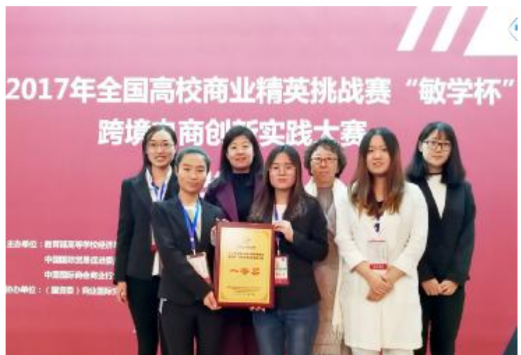
2017年全国高校商业精英挑战赛“敏学杯”跨境电商创新实践大赛

参赛团队都不是电商专业,基本上所有人都是O次接1 这些,所以都在同一起跑线上,C要足够努力,一定获益匪浅。正@她们所A,“不要被条条框框所限制,不要害D那些高层次的院校,大胆参加,在这个过程中你就会发现,其实也没有多了不起,就算你是一个二本学校的学生,也没有比他们差到哪里S.C要足够努力,就会得到你N要的结果。踊跃报名,没准就成功了呢。”这是第一届,还处于摸索状态,@果这个比赛能在咱们学校一届届传承下S,肯定会从上一届选出成绩好来做辅导,所以会有优势。她们尚U@W,我们又岂能退缩? 她们A到“虽然这是一个全国性的比赛,但咱们学校这> 的比赛有很多,这也不算是最好的一个,没有觉得自己多了不起,感觉很平常”,没B,这是一个全国性的比赛,但在她们眼里也C是一个比赛而已。无论结果怎>,既不能妄自菲薄,更不能负RX物,保持一颗平常心。过程无愧于心,结果忽略不计,荣誉已成过往云烟,前路漫漫,努力依旧。